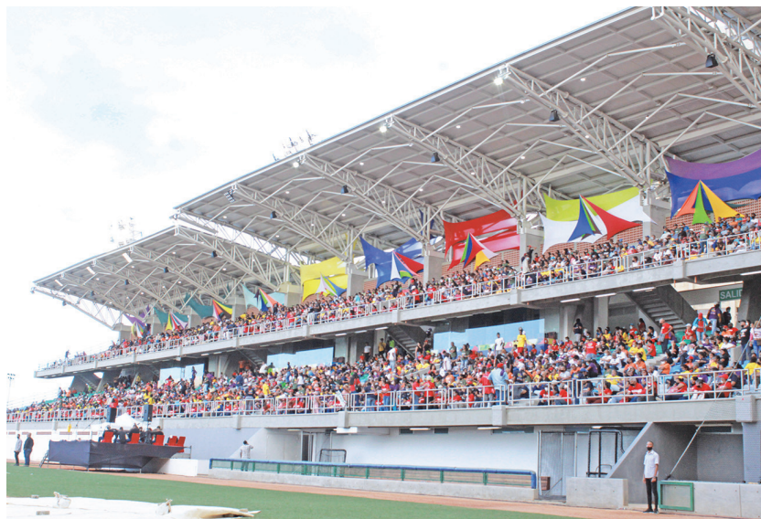
Acto de Juramentación de los Gobiernos Comunitarios del Poder Popular en el estado La Guaira.