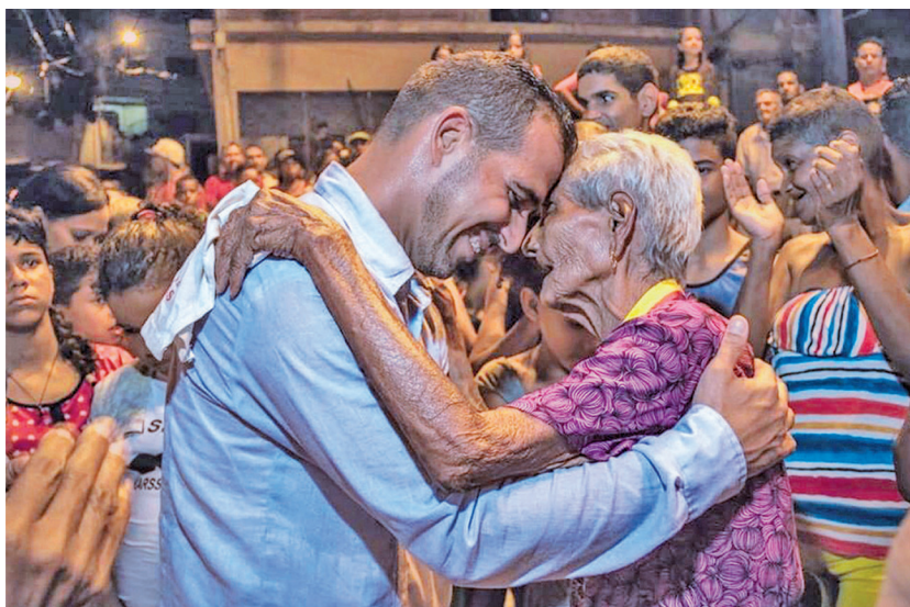
El gobernador José Alejandro Terán: “Somos un pueblo consciente, organizado y movilizado.”

Por último, el miércoles 05 de enero de 2022, se realizaron los primeros encuentros por parroquias, para la conformación, constitución y registro de los gobiernos comunitarios de las comunidades de cada parroquia. Avanzar desde el punto de vista orgánico, para garantizar la conformación, constitución y registros de los Gobiernos Comunitarios. En los encuentros se socializaron el método de funcionamiento y el plan operativo del Sistema de los Gobiernos Comunitarios del Poder Popular. Teniendo en esta primera fase el siguiente resultado: